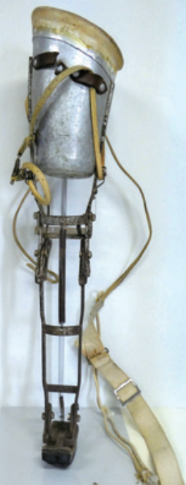
戦傷病者が使用していた義足

同時開催 昭和館「くらしにみる昭和の時代 大分展」/ 平和祈念展示資料館「平和祈念展in大分」