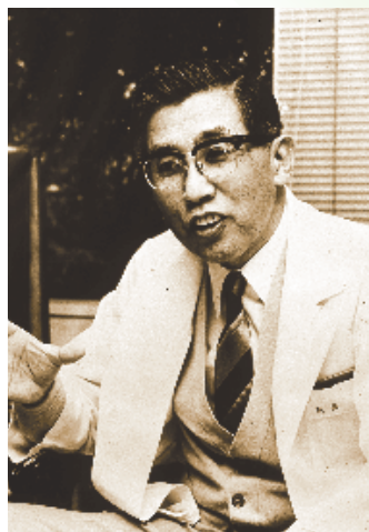
パラリンピック開催に尽力した中村裕博士