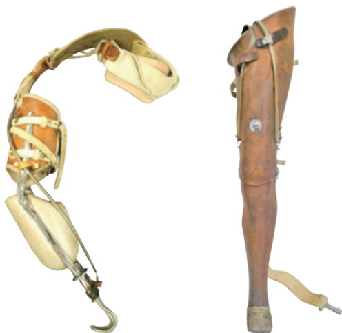
戦傷病者が使用していた義手・義足