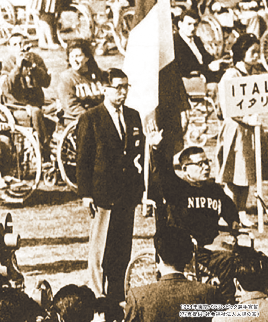
1964年東京パラリンピック選手宣誓